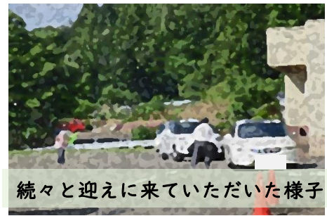
続々と迎えに来ていただいた様子