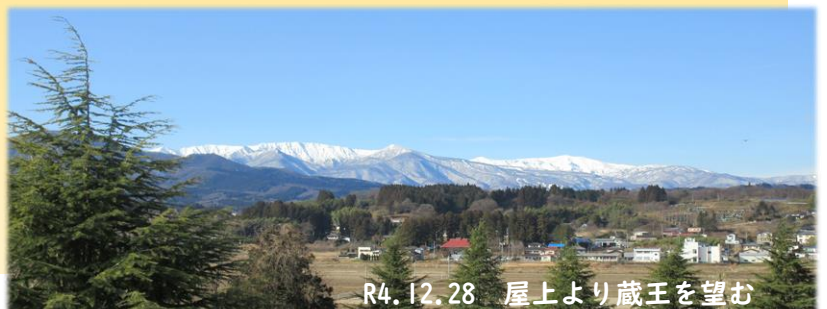
R4.12.28 屋上より蔵王を望む

全員が元気な姿で新年を迎えられたことに感謝するとともに、一人一人が思いやりの気持ちを持ち、これからも全力で学校生活を送れることを願い、あいさつとします。