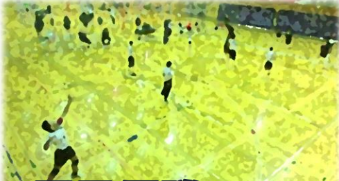
男子優勝! 県大会出場!